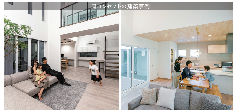
同コンセプトの建築事例