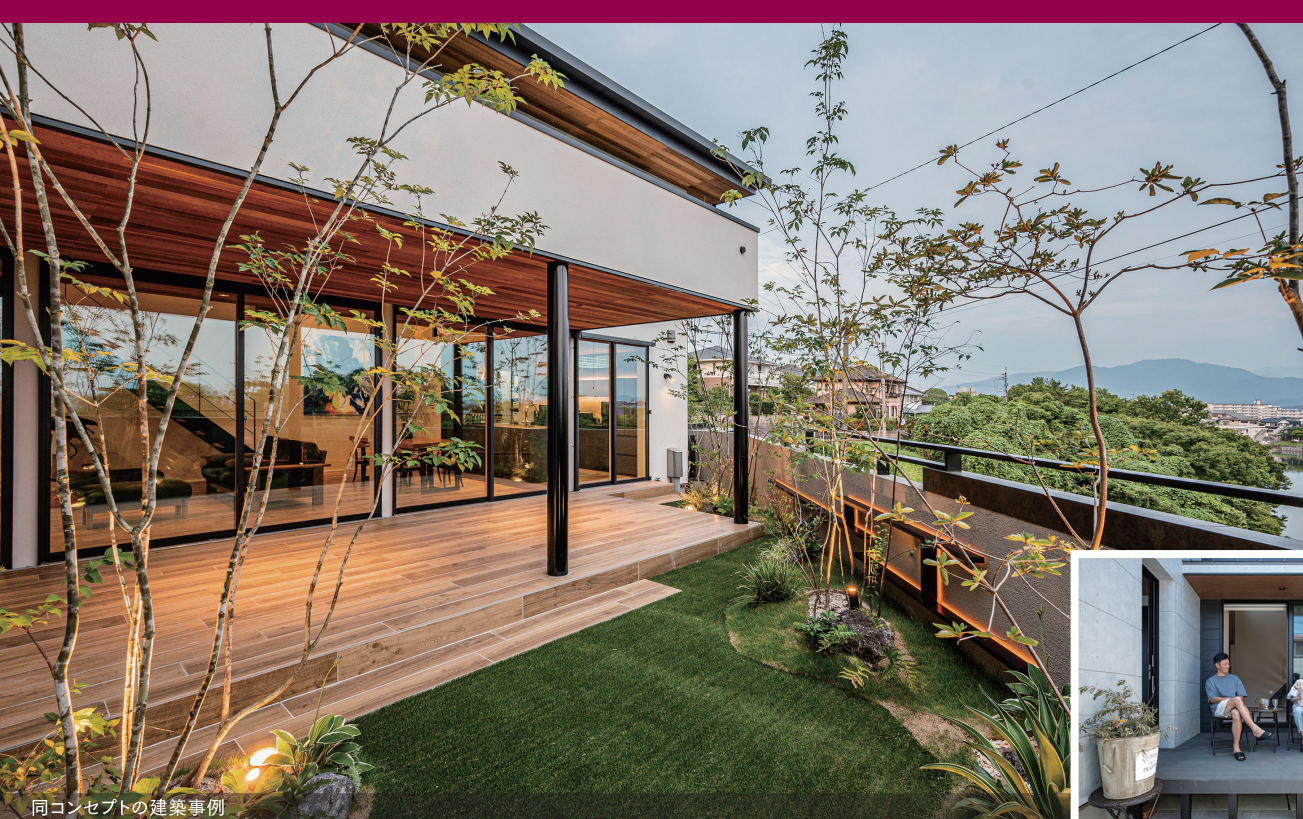
同コンセプトの建築事例