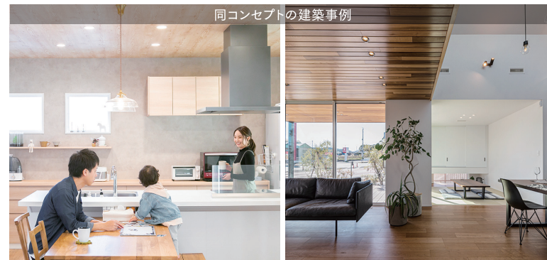
同コンセプトの建築事例