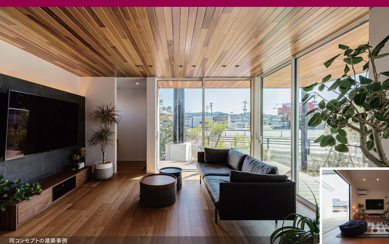
同コンセプトの建築事例