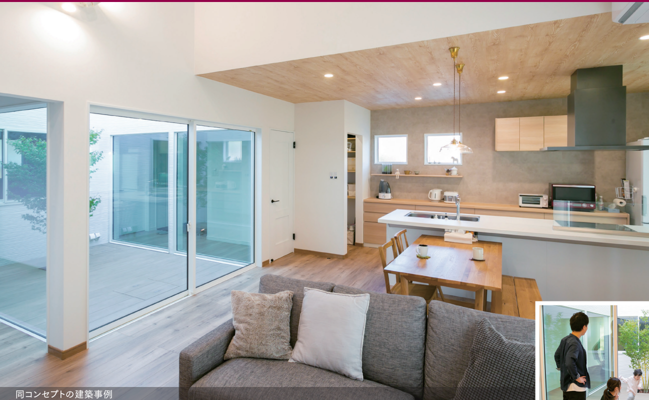
同コンセプトの建築事例