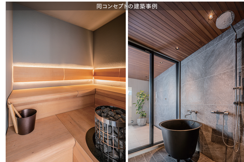
同コンセプトの建築事例