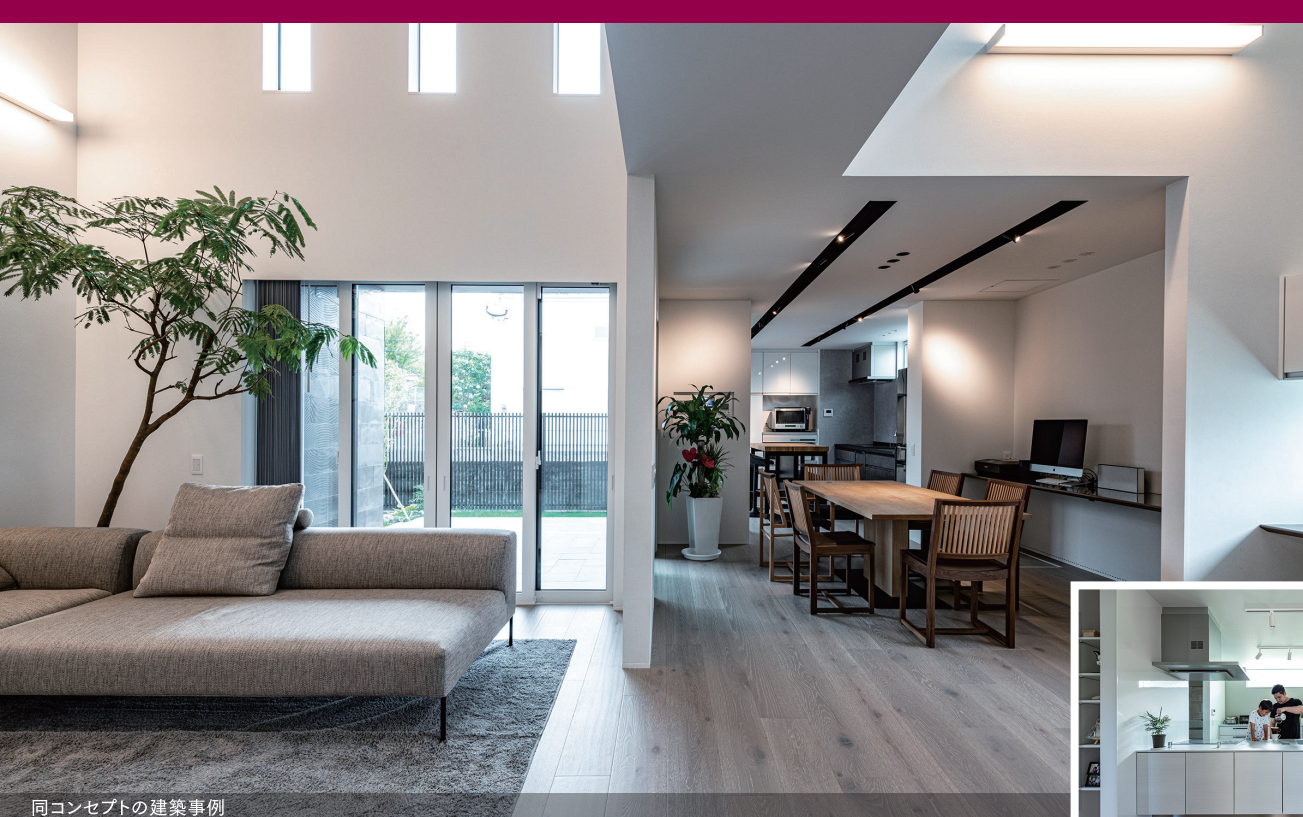
同コンセプトの建築事例