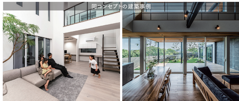
同コンセプトの建築事例